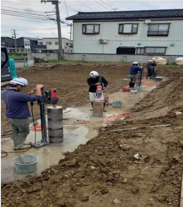
コアボーリングにて基礎縁切り

■ 弊社は大型の機械やダンプ等は所有しておらず、昔から人力での研り・店舗などの改修工事を主とする いわば人海戦術をメインに地域社会に貢献してきました。昔は 30kg のブレーカーも吊り下げて研ると諸 先輩方に怒られ、抱きかかえて下がり壁など壊していました。しかし時代も変わり、今ではそんなことを押し 付けた日には職人も離れていきます。人からモノへという時代の変化に対応し、職人の負担を少しでも 減らせるように安心・安全の職場づくりを目指しています。